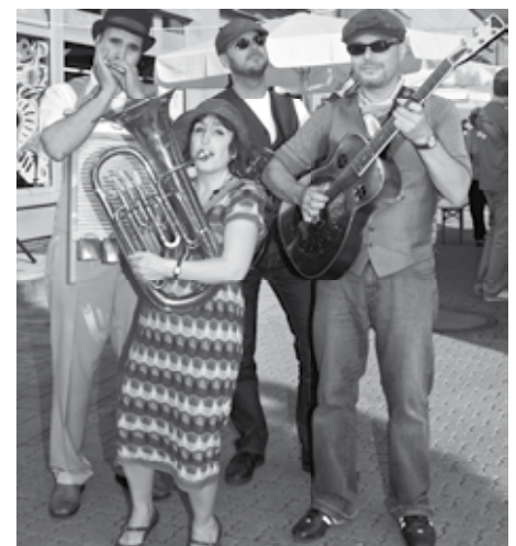
Die Festgäste (Mitte), Mitarbeiterinnen des Sozialprojekts Café Netzwerk (oben) und die Autobahnkapelle (unten)